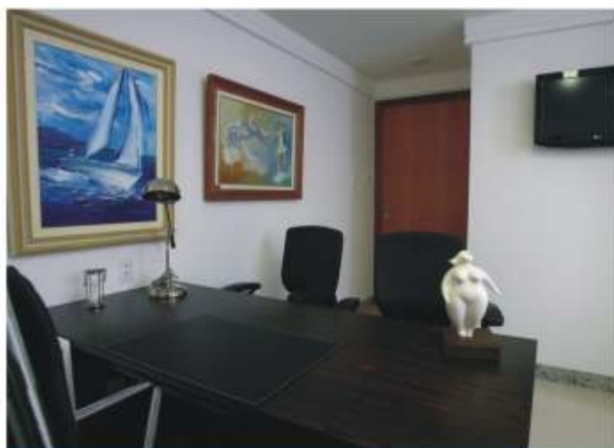
Consultórios médicos bem equipados e totalmente informatizados

O Centro Médico concentra as especialidades médicas de: Angiologia, Cardiologia, Cirurgia Bariátrica, Cirurgia Cardíaca, Cirurgia de Cabeça, Pescoço e Crânio-Maxilo-Facial, Cirurgia Geral, Cirurgia Plástica, Cirurgia Torácica, Cirurgia Vascular, Coloproctologia, Dermatologia, Endoscopia Digestiva, Gastrohepatologia, Ginecologia, Infectologia, Núcleo de Obesidade, Mastologia, Nefrologia, Neurologia, Neurocirurgia, Obstetria, Odontologia, Oftalmologia, Ortopedia, Otorrinolaringologia, Reumatologia, Pneumologia e Urologia, que atuam de maneira integrada com o Hospital Espanhol