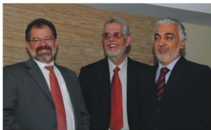
Marcaram presença na inauguração o presidente da Assembleia Legislativa da Bahia, Marcelo Nilo , o secretário estadual de Saúde, Jorge Solla , e o secretário municipal de Saúde, José Carlos Brito .