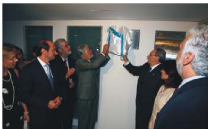
O governador Jaques Wagner e o Sr. Manuel Antas Fraga descerraram a placa de inauguração do Centro Médico do HE.

Durante seu discurso no evento, o governador agradeceu pela coragem, ousadia e determinação dos dirigentes do HE que, em tempos de crise na Saúde baiana, conseguiram promover a expansão do hospital. Wagner também destacou os investimentos que o governo do Estado vem fazendo no setor, como reformas, ampliação e construção de hospitais. "Fico feliz que o Hospital Espanhol tenha ampliado o seu atendimento ao público. A saúde é um dos principais setores e o Governo do Estado tem dado prioridade à área", destacou o governador.