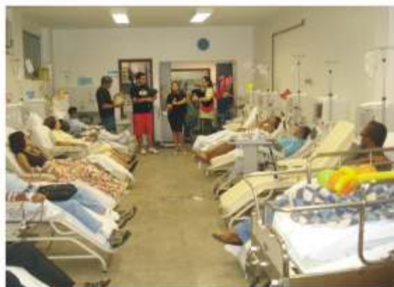
Grupo Celta anima pacientes no Serviço de Hemodiálise.